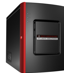
Ihr E-Mail Archiv